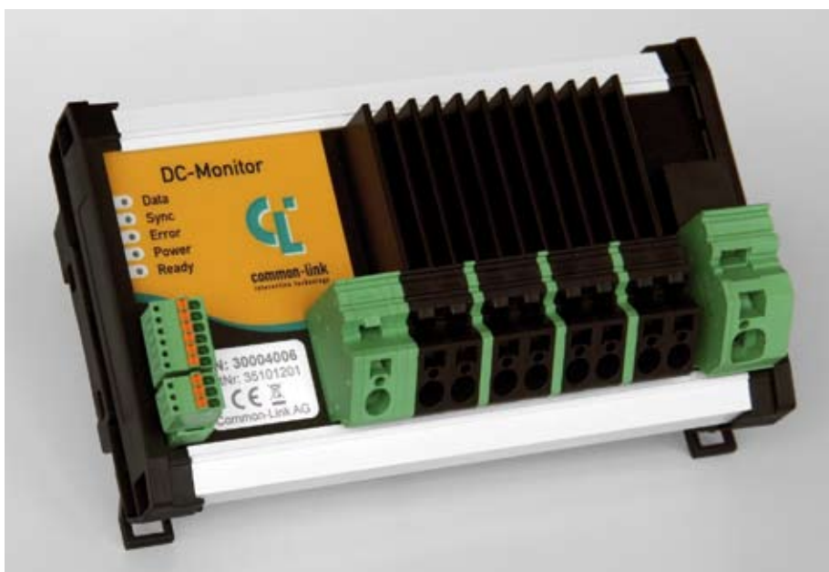
Innovativ und kompakt: Beim „DC-Monitor“ ist die Sammelschiene bereits integriert.